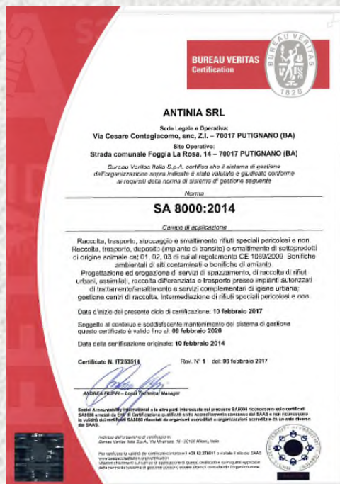
Certificazione SA 8000

Maggiori dettagli ed informazioni sono presenti sul sito web: www.antinia.it , alla voce "Certificazioni"