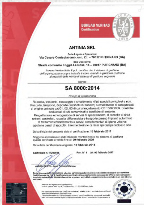
Certificazione SA 8000

Maggiori dettagli ed informazioni sono presenti sul sito web: www.antinia.it , alla voce "Certificazioni"